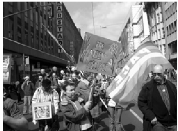
Bonne ambiance sur la Tonhallenstr.

Dans une longue marche la démonstration se remuait vers la Muensterstrasse de Duesseldorf-Derendorf et vers le centre-ville au Landtag. Là-bas la manifestation finale avait lieu. ■