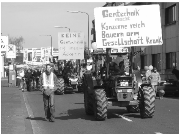
Les tracteurs de proteste roulent vers le Landtag

« L'âge de la recherche de la nature est passé,