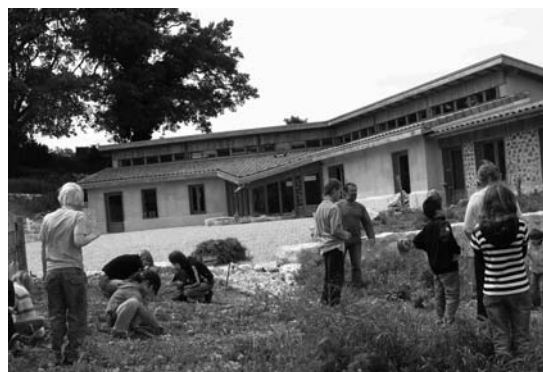
Aux Amanins, une école où les enfants font le lien entre les savoirs et la vie concrète, où ils apprennent à vivre dans la coopération.