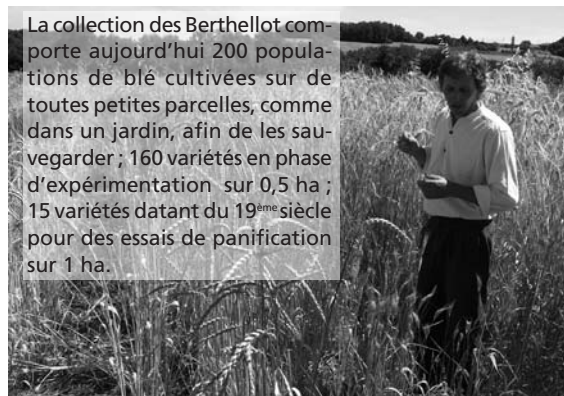
La collection des Berthelot comporte aujourd'hui 200 populations de blé cultivées sur de toutes petites parcelles, comme dans un jardin, afin de les sauvegarder ; 160 variétés en phase d'expérimentation sur 0,5 ha ; 15 variétés datant du 19 ème siècle pour des essais de panification sur 1 ha.

D'après un texte d' Hélène Zaharia , issu d'un ouvrage à paraître en juin 2008 : « Voyage autour des blés paysans », édité par le Réseau Semences Paysannes www.semencespaysannes.org