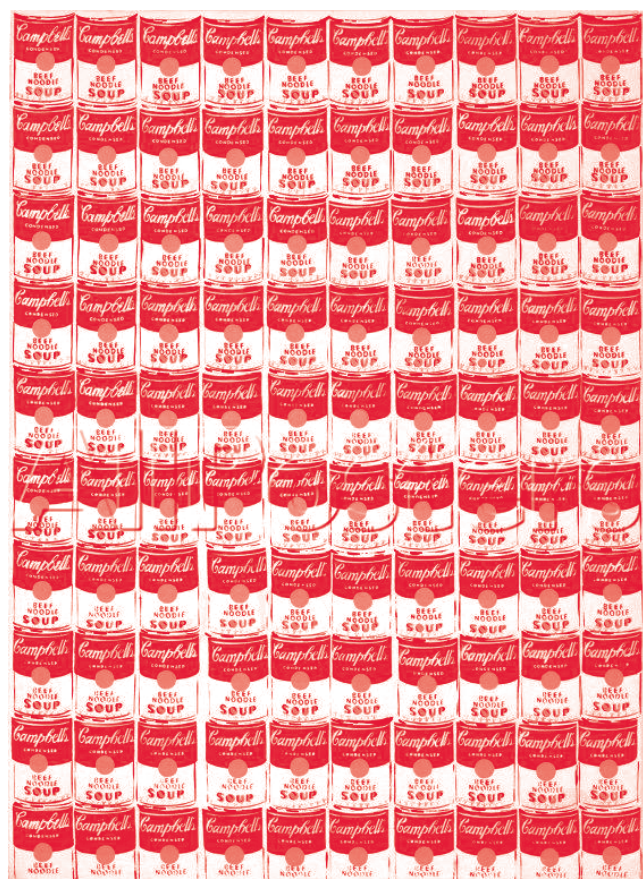
Boîtes de soupe Campbell's peintes en 1962 par Andy Warhol