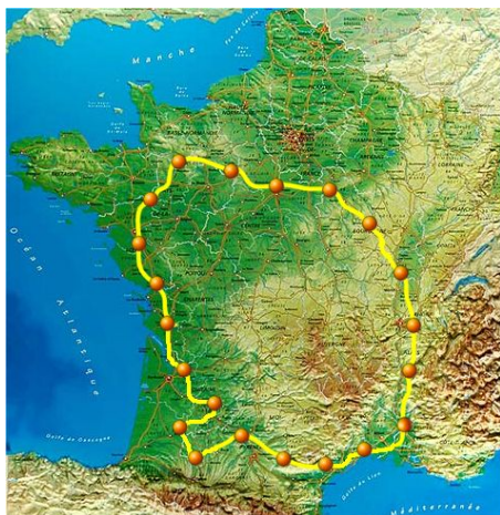
Carte de France cycliste en juillet 2008

Le Tour de France de la Biodiversité Libre et Non dopée, réalisé par une équipe de citoyens organisés en relais, constitue un exemple d'action solidaire destinée à l'information du public.