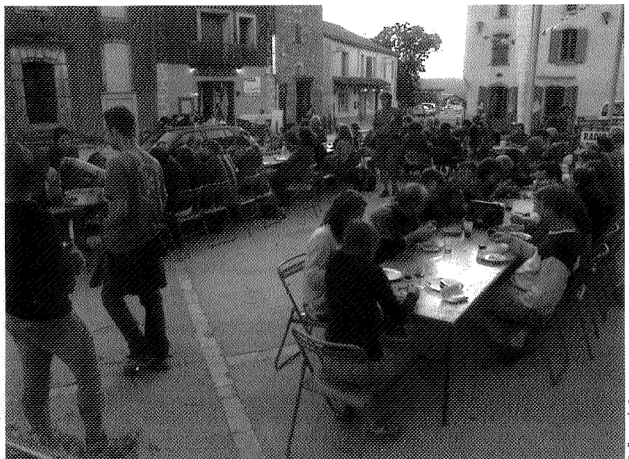
Guillaume de Crop